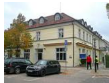
Angst vor Neonazis – Infoabend abgesagt