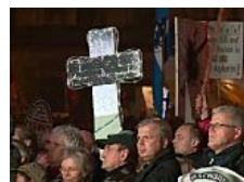
Zehntausende Anhänger und