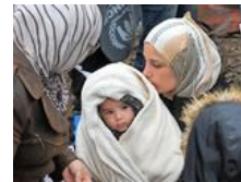
Flüchtlinge irren allein zur Unterkunft