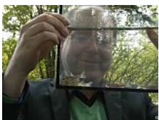
Agrarminister Meyer wird