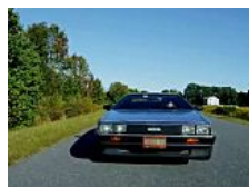
Stichtag: «Zurück in die