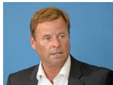
Brandenburg will Hälfte der Kosten vom Bund