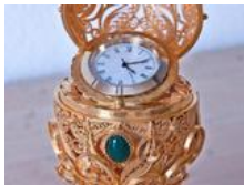
Schöner Nachtrag von der Geburtstagsfeier